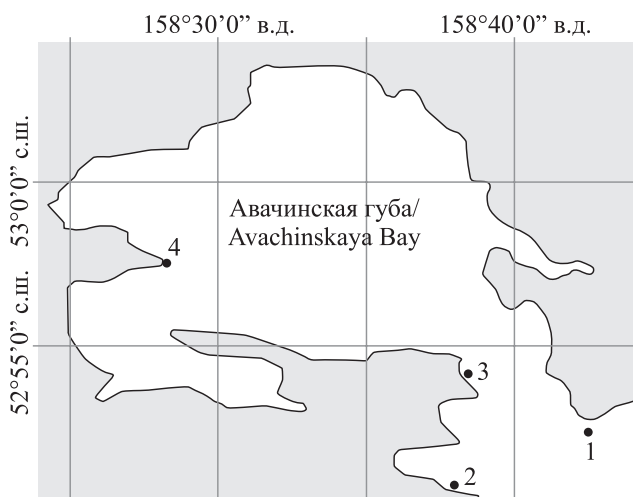
Рис. 1: Карта-схема расположения станций в Авачинской губе летом 2000 г.: 1 — мыс Маячный; 2 — бухта Безымянная; 3 — кекур Бабушкин Камень; 4 — мыс Казак

Оценка степени наполнения кишечника пищей осуществлялась визуально по трехбалльной шкале: 1 — кишечник наполнен слабо, менее половины его объема занято пищей; 2 — среднее наполнение кишечника, кишечник наполнен примерно наполовину; 3 — хорошее наполнение кишечника, большая часть его объема заполнена пищей. В стационарных условиях с использовани-