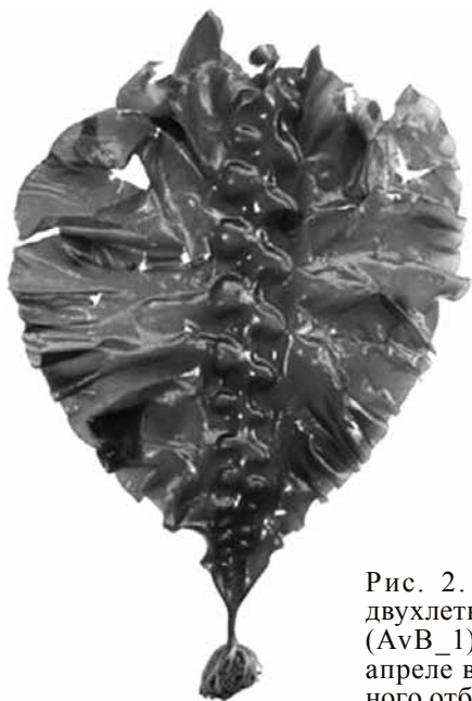
Рис. 2. Внешний вид двухлетней Laminaria sp. (AvB_1), собранной в апреле в месте постоянного отбора проб

Далее из сухой пробы брали навески для определения, в соответствии с ГОСТ 26185–84, содержания в ней альгиновых кислот и маннита. Путем сжигания в муфельной печи третьей навески из той же сухой пробы определяли содержание минеральных веществ, а в полученной золе, согласно того же ГОСТ, определяли относительное содержание йода. Количество органических веществ у водорослей устанавливали как разницу между весом сухой пробы и весом золы. Ниже обсуждаются результаты, полученные в ходе проведенного исследования.