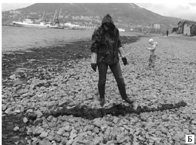
Рис. 1. Район исследования: а — место сбора проб во внутренней части Авачинской губы; б — городской пляж у сопки Никольской в месте сбора материала во время сизигийного отлива